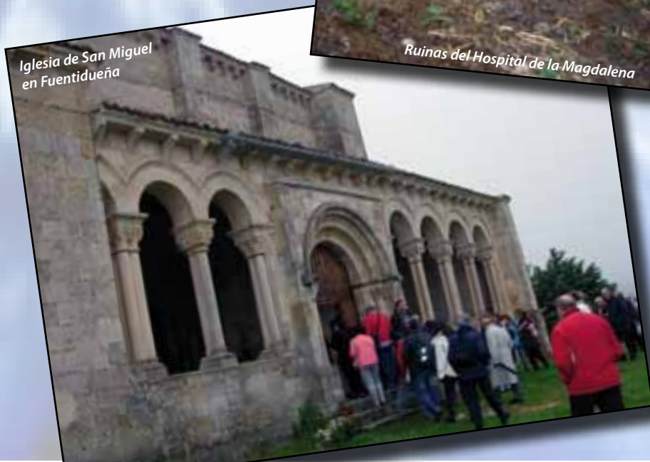
Iglesia de San Miguel en Fuentidueña