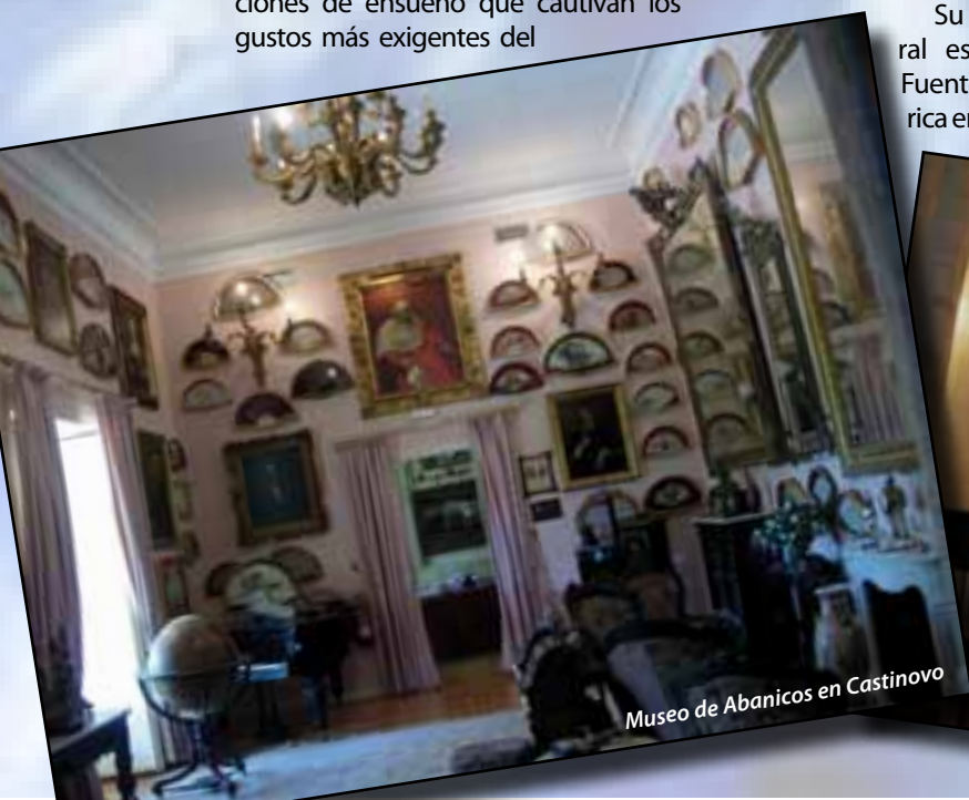
Museo de Abanicos en Castinovo

rosos manantiales y dos ríos, el Duratón y el Fuentes, este de corto recorrido. Como en tantos pueblos de la península ibérica, aquí se asentaron en la antigüedad diferentes pueblos como los vaceos, celtas, arévacos, romanos, visigodos, judíos y árabes. Desde la contraofensiva de Almanzor en el siglo X y su derrota en la batalla de Calatañazor en 1002, esta villa y su alfoz, es gobernada por reyes y nobles cercanos a la realeza, destacando Alfonso VIII por establecer una importante política repobladora y por significar una etapa floreciente para Fuentidueña.