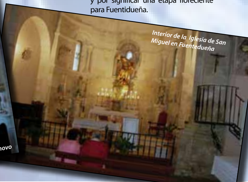
Interior de la Iglesia de San Miguel en Fuentidueña