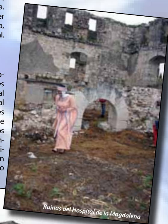
Ruinas del Hospital de la Magdalena

Entre sus monumentos más emblemáticos están el Puente Romano sobre el río Aguijesejo, sobre el que se alza el Arco, una de las tres puertas que tenía la ciudad. En sus proximidades, el Palacio de Contreras, hoy sede de la Oficina de Turismo, linda con la Plaza Mayor en donde se encuentra el Ayuntamiento del siglo XVI, edificio que al parecer fue el primer palacio de los Marqueses de Villana. En el centro de la majestuosa plaza se levanta La Fuente con nombre propio, mandada construir en 1892 para conmemorar el IV Centenario del Descubrimiento de América, testigo mudo de la historia y avatares del pueblo.