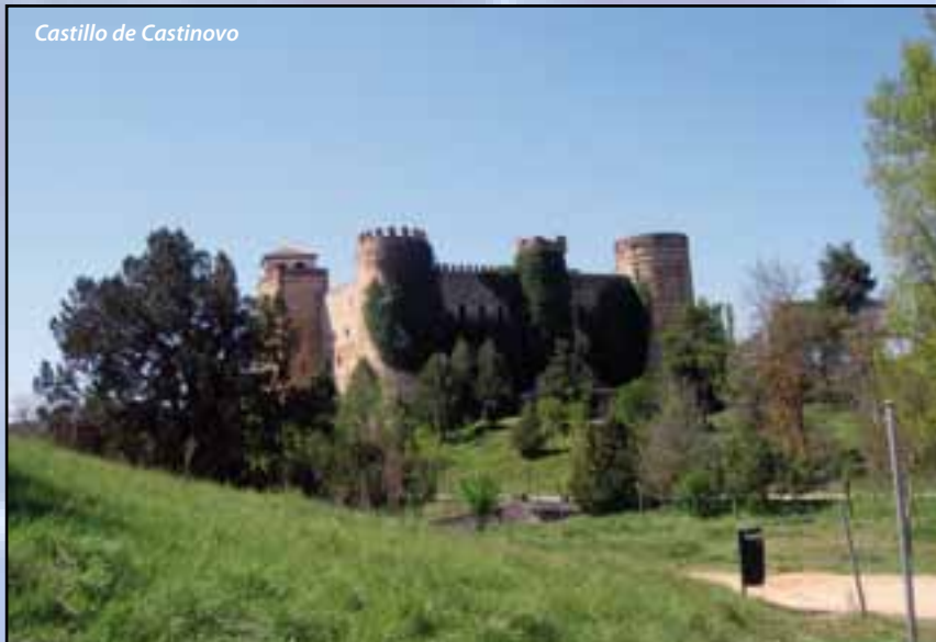
Castillo de Castinovo

Precisamente en la iglesia de San Martín, a través de la imagen, la música y la palabra, se puede comprender el arte mudéjar, participar en su construcción y comprobar como convivían en buena armonía en el siglo XII, las tres culturas medievales de la península judíos, musulmanes y cristianos. Al pasear por sus viejas y empinadas calles, sorprende la gran riqueza monumental que el paso de la historia ha ido dejando en sus palacios, casas blasonadas, conventos, castillo y, especialmente, las iglesias con sus torres de piedra que marcan y definen el perfil de la ciudad.