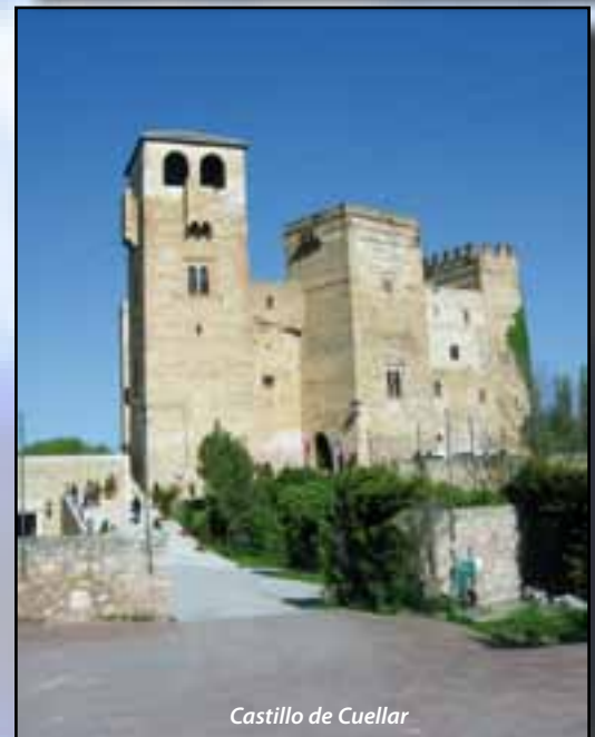
Castillo de Cuellar