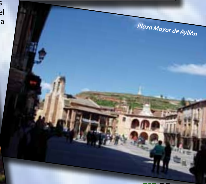
Plaza Mayor de Aillón