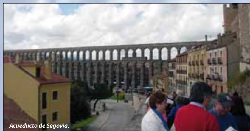
Acueducto de Segovia.

Texto y fotos: José Antonio Fernández Cuesta