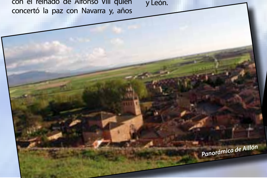
Panorámica de Aillón