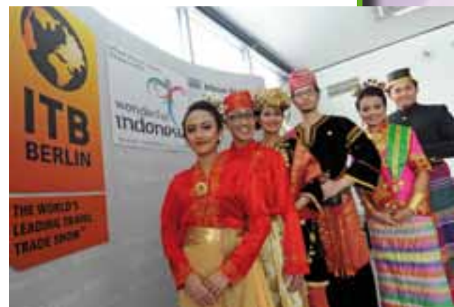
Indonesia, país invitado

La participación en este conjunto de eventos, debates, conferencias y foros dedicados al intercambio de puntos de vista y el análisis de la