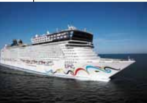
Barco Norwegian Epic.