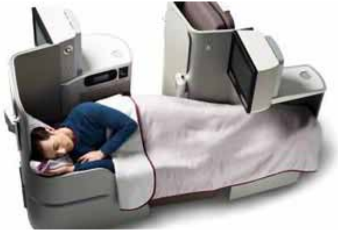
Las butacas de la clase Business del nuevo A330-300.