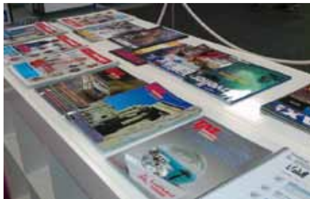
Varios ejemplares de TAT y del Boletín Electrónica en la Exposición

La próxima edición de ITB Berlín se celebrará del 5 al 9 de marzo de 2014. ●