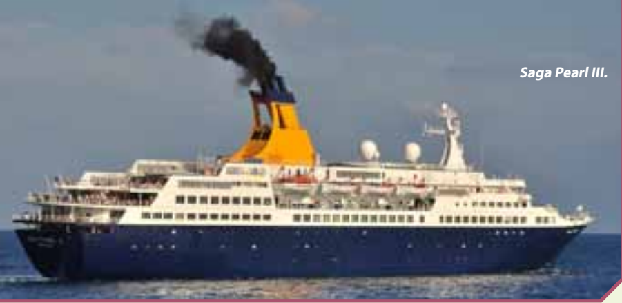
Saga Pearl III.

en lugar de su habitual invernada en Brasil. Esto ha provocado un incremento de la oferta superior al 15%.