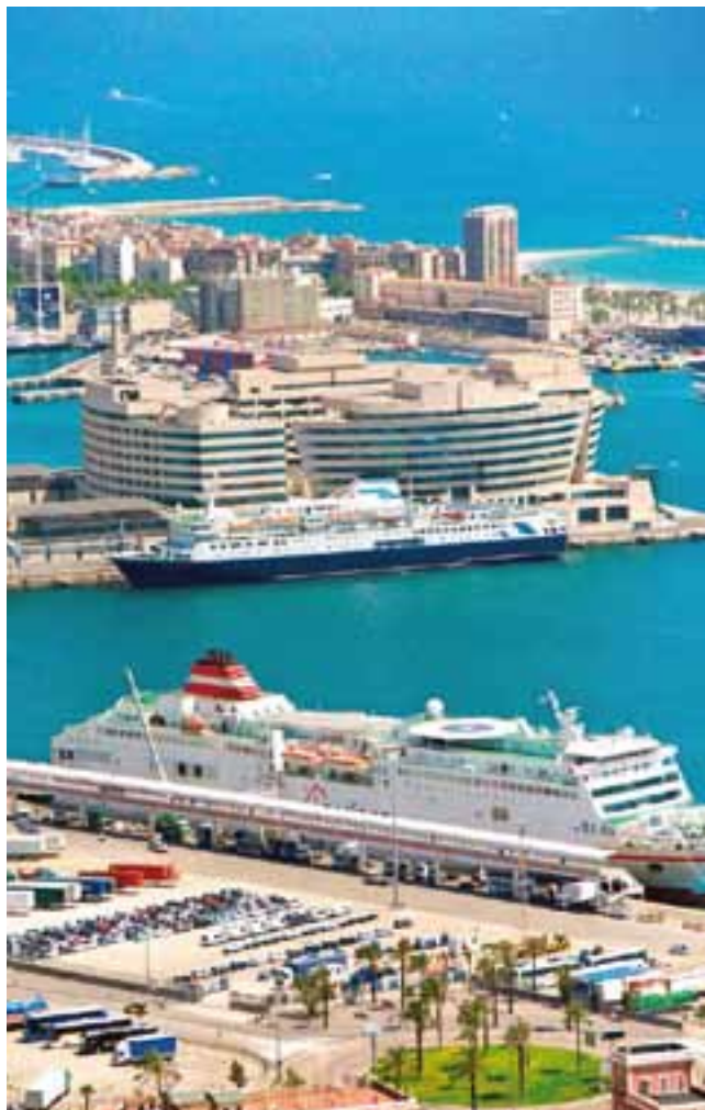
Puerto de Valencia, que aumentó notoriamente su actividad el pasado año.

D urante la celebración de la feria Seatrade , Puertos del Estado presentó la Blue Carpet. La alfombra azul que recibe a todos los visitantes que lleguen a España a través de sus puertos, es el concepto elegido para la campaña en el ámbito de cruceros.