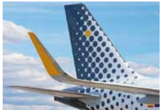
A320 con las nuevas alas "Sharklets".

Vueling es la primera aerolínea del sur de Europa en incorporar esta tecnología como parte de su flota de 70 aviones. Vueling incorporará este verano nueve nuevos aparatos, ocho de ellos con sharklets y de la mano de los lesores BOC Aviation, AWAS, Aviation Capital Group (ACG) y CIT Group. ☺