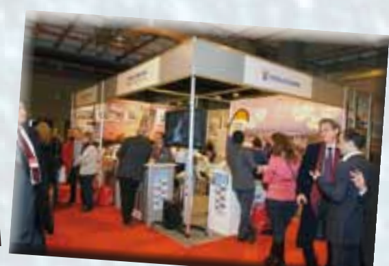
TAT un año más estuvo en la Feria