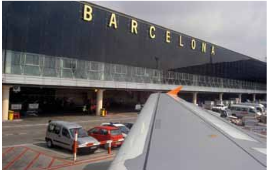
Aeropuerto El Prat perdió casi el 5% de pasajeros, en el primer trimestre de 2013.

En el primer trimestre, 34,5 millones de personas pasaron por los aeropuertos controlados por Aena, un 8,2% menos que en el mismo periodo del año pasado y un 15,9% menos de operaciones. De los 40 aeropuertos españoles, solamente cuatro presentaron más pasajeros en tasa interanual: Reus, Badajoz, Asturias y Huesca. Los principales, por el contrario, registraron una caída en picado: Madrid con 8,7 millones de pasajeros pierde un 15% de pasajeros y de movimientos seguido de Barcelona con una caída de casi el 5% en el número de pasajeros y del 9,6% en el de vuelos.