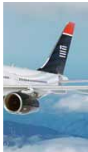
Colas Aviones AA y US Airways.

Operando bajo el nombre de American Airlines, la compañía combinada tendrá una potente red global y una base financiera sólida. Con pedidos en firme por más de 600 aviones de largo recorrido, la nueva aerolínea combinada tendrá una de las flotas más modernas y eficientes en la industria y una base sólida para la inversión continua en tecnología, productos y servicios.