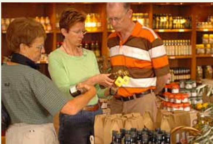
Turistas comprando en tienda de licores en Baleares

Francia (+21,3%) y los Países Nórdicos (+12,2%) fueron los mercados que más contribuyeron al crecimiento del gasto turístico internacional en el mes de febrero. Cataluña y Canarias fueron las regiones más beneficiadas.