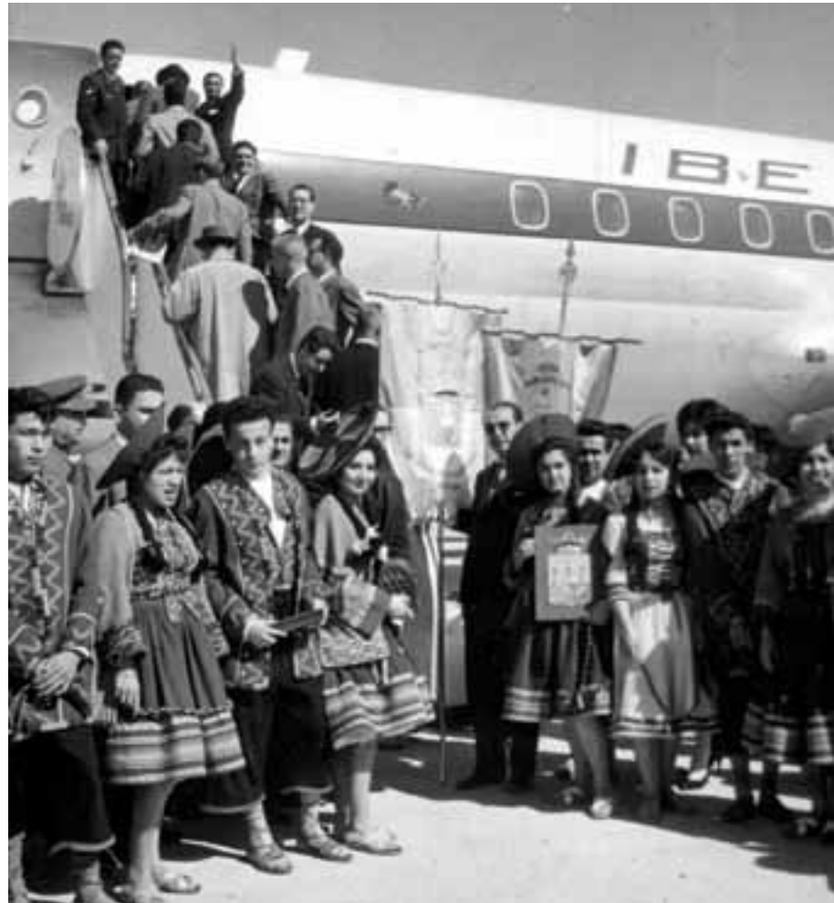
Primer vuelo de Iberia a Lima, en 1963.

Las cosas han cambiado mucho desde entonces. Actualmente el vuelo entre Madrid y Lima es directo y dura aproximadamente doce horas –sale a las