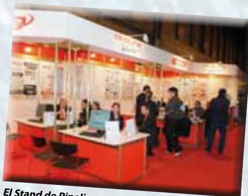
El Stand de Pipeline