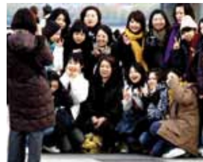
Grupo de turistas Chinos

Entre los diez principales figura Rusia, que experimentó un incremento del 32% en 2012, alcanzando los 43.000 millones de dólares (33.620 millones de euros), pasando del séptimo al quinto lugar en gasto en turismo internacional. Destaca también Brasil que, a pesar de no situarse entre los diez primeros, se desplazó del puesto 29 al 12, con un gasto de 22.000 millones de dólares (17.201 millones de euros) en 2012. ●