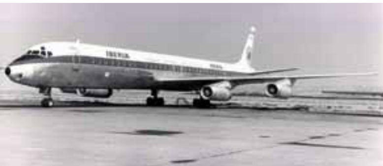
El avión DC8 que volaba a Lima.

Los vuelos entre España y Perú son operados por el avión más grande de la flota de Iberia, el Airbus A340-600, con capacidad para 342 pasajeros –42 en Business y 300 en Turista-. La gran novedad es que a partir del próximo mes de mayo a los 17 A340-600 de que dispone Iberia se les irá incorporando la nueva Business y la nueva Turista de largo radio. ☺