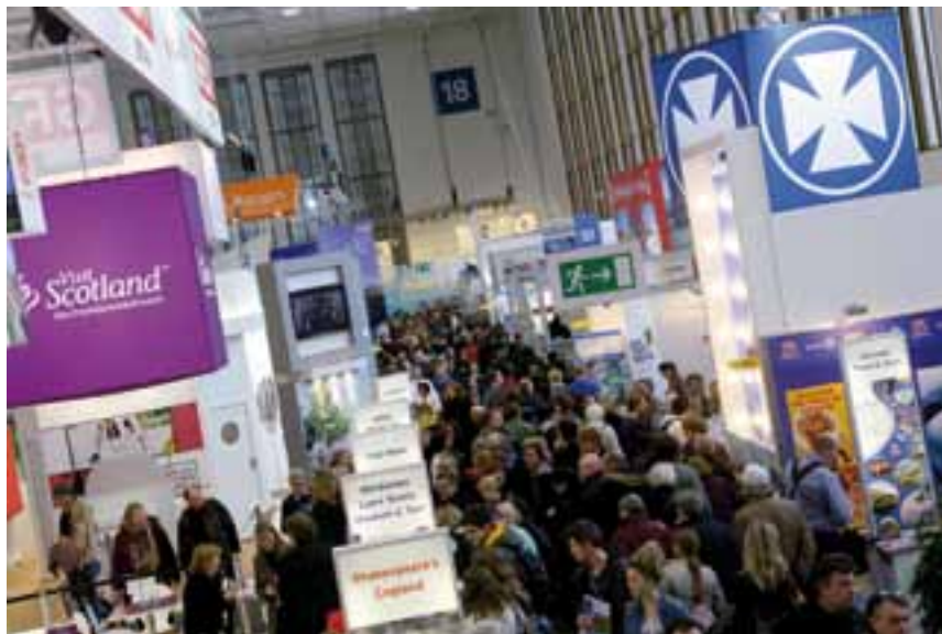
Vista general del pabellón 18

En esta ocasión el país invitado fue Indonesia, cuyo presidente, Susilo Bambang Yudhoyono, inauguró el evento junto a la canciller alemana Angela Merkel. Estuvieron presentes también representantes de la Organización Mundial del Turismo (OMT); la Pacific Asia Travel Association (PATA) y el World Travel & Tourism Council (WTTTC). Las Numerosas delegaciones presentes (más de 100 ministros y secretarios de estado acudieron este año a la feria) dan una idea de la importancia de ITB BERLIN como evento político y turístico en todo el mundo, un dato avalado por la presencia de 110.000 visitantes profesionales, de los que un muy notable 43% procedía de fuera de Alemania. Durante el fin de semana, más de 60.000 visitantes recibió el recinto ferial, y como novedad, pudieron reservar directamente en la feria.