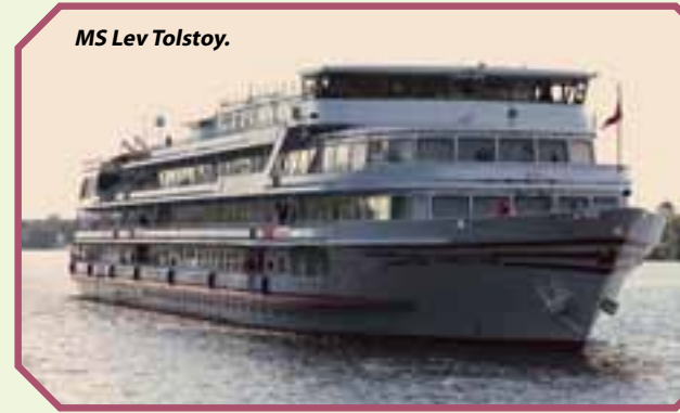
MS Lev Tolstoy.

Los datos de Puertos del Estado, tras el año excepcional para el tráfico de cruceros turísticos que supuso 2011, muestran un preocupante retroceso. Nuevamente, veinticuatro enclaves portuarios recibieron 3.723 buques (3.901 escalas en 2011), con un descenso del 4,7%, transportando 7.567.520 pasajeros (7.997.893 pasajeros en 2011), con una notable reducción del 5,4%. De ese total, cerca de un tercio correspondió a Barcelona (2.408.960 pasajeros, a pesar del descenso del 8,84%), con Baleares en segundo puesto, con 1.269.208 pasajeros y un descenso espectacular del 21,39%. De