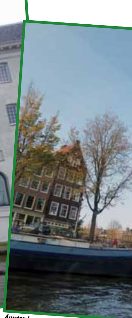
Amsterdam a través de uno de sus canales.