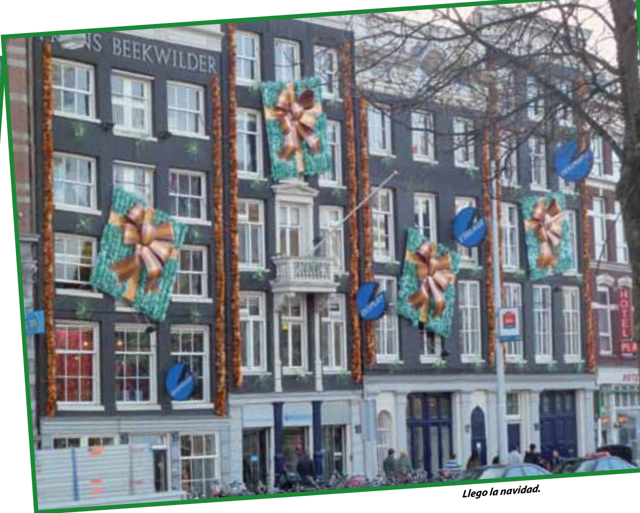
Llego la Navidad.

Por lo demás la ciudad sigue siendo igual de cosmopolita y abierta a todo el mundo por lo que encuentras gentes muy diversas y escuchas gran variedad de idiomas. Sus locales de ocio, degustación, gastronomía, cervecerías, souvenirs, moda y más de 15 ofertas de atracciones que durante las 24 horas del día ofrecen al visitante una gran actividad.