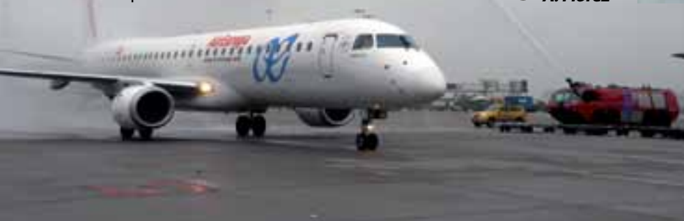
Llegada del avión.