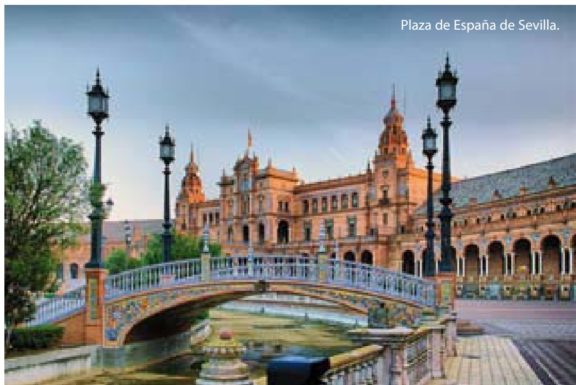
Plaza de España de Sevilla.

Con la entrada de España en el Mercado Común, años más tarde Unión Europea, llegan a nuestro país numerosos ingresos gracias a los Fondos Regionales y al Programa Leader para el desarrollo de un nuevo tipo de turismo como el rural. En la temporada 85-86, comienzan los Programas del Inmerso que tanto han ayudado a desestacionalizar el turismo y permitido que las familias más desfavorecidas, pudieran disfrutar de unos días de vacaciones. En 1987, la Unión Europea inicia la liberalización del transporte aéreo y en España se rompe el monopolio de Iberia e irrumpen en el mercado nuevas compañías como Spanair y Air Europa que compiten bajando las tarifas. El Camino de Santiago es declarado el Itinerario Cultural Europeo. Son unos años en los que los españoles viajan con más frecuencia al extranjero al ser mayor su poder adquisitivo y ser más favorable el tipo de cambio. El turismo sigue creciendo pero con una nueva visión: la cultura del turismo sostenible. Por eso, al año siguiente,