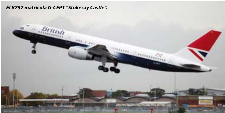
El B757 matrícula G-CEPT "Stokesay Castle".

El avión pintado vuela bajo el nombre de G-CEPT "Stokesay Castle", tal y como ha autorizado el organismo que regula el Patrimonio Histórico de Inglaterra. Esta iniciativa, recuerda a los primeros B757, a los que siempre se bautizó con los nombres de castillos ingleses. ☺