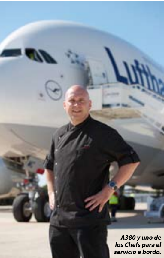
A380 y uno de los Chefs para el servicio a bordo.

D eutsche Lufthansa AG ha alcanzado un beneficio de explotación de 783 millones de euros en el tercer trimestre del ejercicio en curso, 565 millones de euros más que en el mismo trimestre del año anterior. Este resultado es producto del positivo desarrollo en el aumento de la demanda en el tráfico de pasajeros y mercancías, y del programa de reducción de costes en todas las áreas del Grupo. Las compañías del Grupo han podido defender y, en parte, consolidar sus fuertes posiciones en sus respectivos mercados gracias a las ofertas adaptadas a cada mercado, y después de que algunos acontecimientos han ocasionado pérdidas de explotación en los primeros seis meses del ejercicio, el Grupo consiguió alcanzar en los nueve primeros meses del año unos beneficios de explotación globales de 612 millones de euros. Un aumento de 386 millones de euros, sobre el ejercicio anterior. El volumen de negocio se incrementó en 4.000 millones de euros hasta alcanzar los 20.200 millones de euros. ☺