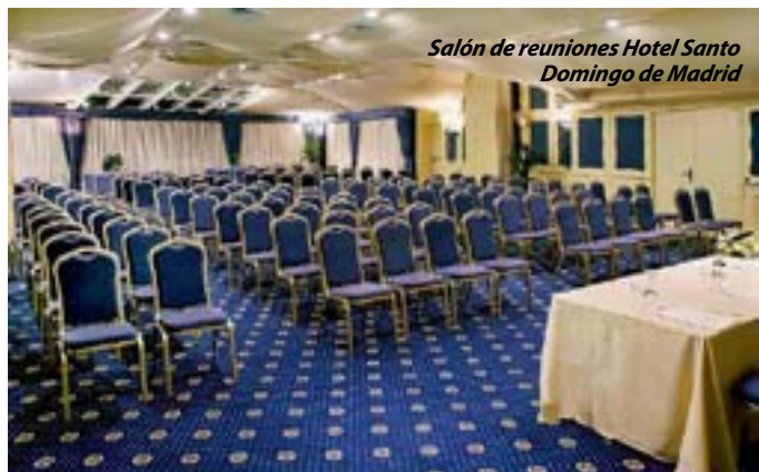
Salón de reuniones Hotel Santo Domingo de Madrid

Es mucho más que una mascota, más que un animal de compañía, es un compañero, un buen amigo y parte de la familia, y, sin embargo, muchos establecimientos hoteleros les tienen prohibida la entrada, o piden un suplemento que eleva demasiado el precio de la habitación. No en el Hotel Axor Feria*** y el Hotel Axor Barajas**** , ambos de la cadena Axor Hoteles . Ubicados en Madrid, tratan a las mascotas con el mismo cariño que lo hacen sus dueños y lo ofrecen, sin ningún coste adicional.