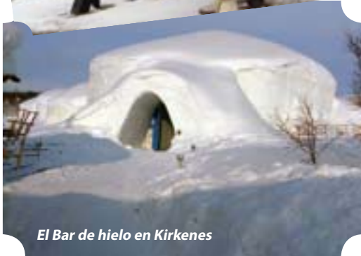
El Bar de hielo en Kirkenes

pasábamos por el estrecho paso de Raftsundet, las montañas majestuosas y amenazantes se estrechaban y nos encerraban, y con el cañón de luz encendido y en movimiento daba la sensación de brillantes cascadas cayendo del cielo a gran velocidad, el espectáculo era impactante.