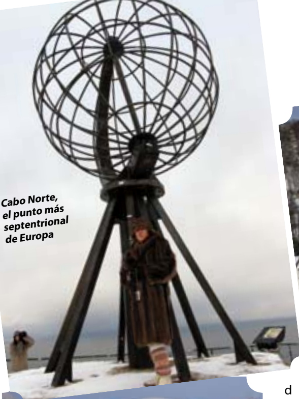
Cabo Norte, el punto más septentrional de Europa