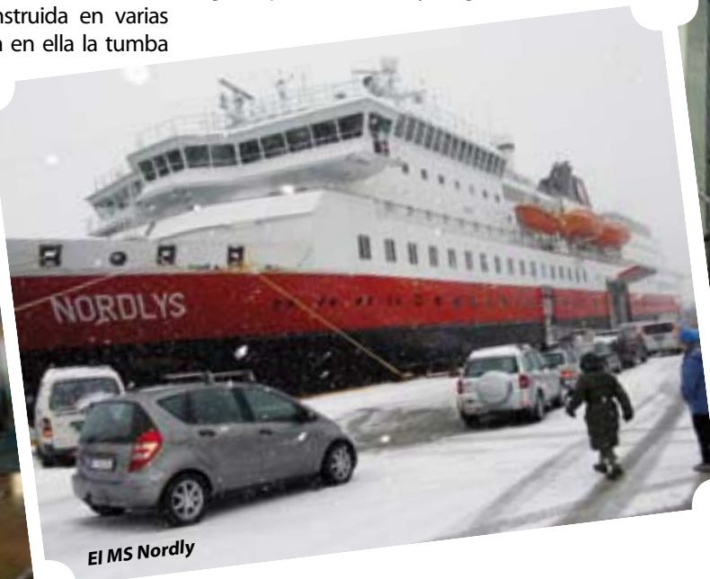
El MS Nordly