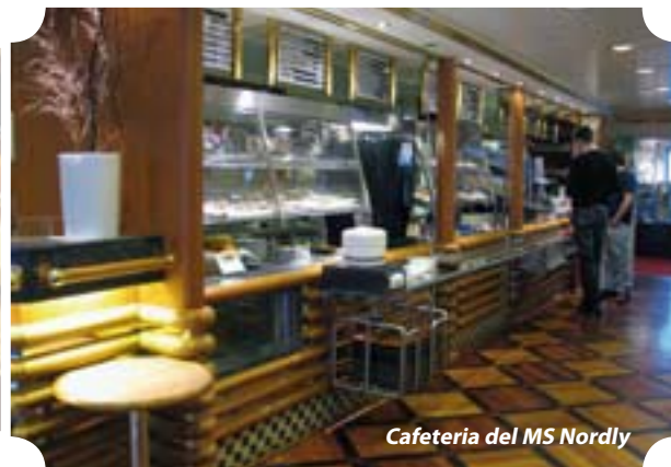
Cafetería del MS Nordly