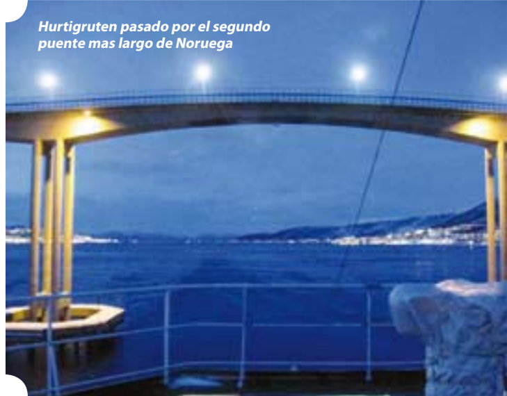
Hurtigruten pasado por el segundo puente mas largo de Noruega

ruta de islotes y arrecifes que hacían muy laboriosa la navegación, llegamos a un puerto pesquero donde descubrimos su arquitectura "Art Nouveau" en el centro antiguo de la ciudad, reconstruida a principios del siglo XX, después de que un incendio en 1904 la destruyera; esta rodeada de agua y resulta muy pintoresca, no había demasiada nieve, pero si la lluvia era molesta para las fotos, pero tenía mucha animación sus calles, y el gran centro comercial estaba saturado de visitantes..