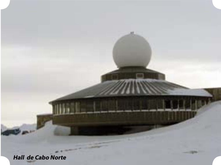
Hall de Cabo Norte