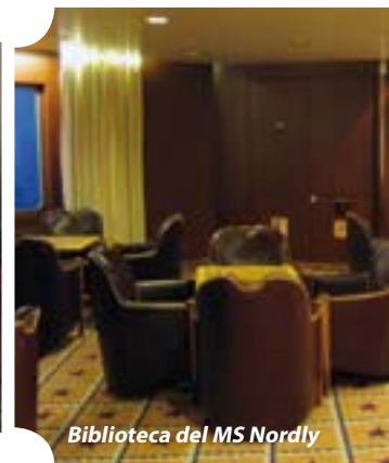
Biblioteca del MS Nordly

Te recomendamos donde cambiar el dinero con mejor cambio, los taxistas son muy agradables y te informan de lugares.