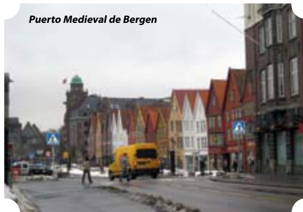
Puerto Medieval de Bergen

por parajes muy nevados, atracamos en el puerto de Haveysund, y pudimos apreciar lo dura que es la vida en esta región del norte, y menos mal que tienen el "Expreso del Litoral". Por fin llegamos a Honningsvåg, el Cabo Norte , el punto más septentrional del planeta, situado a 307 metros por debajo del nivel del mar, y a 71° 10' 21" de latitud. Desde el puerto fuimos varios autobuses tras una quitanieves, por un paisaje bellissimo de altas y suaves cumbres tan completamente nevadas y tan incólume la nieve que parecía de ensueño, además para que el día fuera perfecto tuvimos un sol magnífico.. Aquí viven de la pesca, el mar de Barents nunca se hiela, y en verano tienen una playa, que la llaman Copacabana y disfrutan de 25° en ese tiempo estival. En estos momentos estábamos a -16° , pero