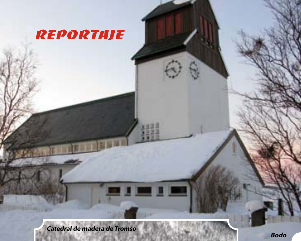
Catedral de madera de Tromso