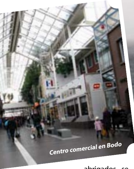
Centro comercial en Bodo