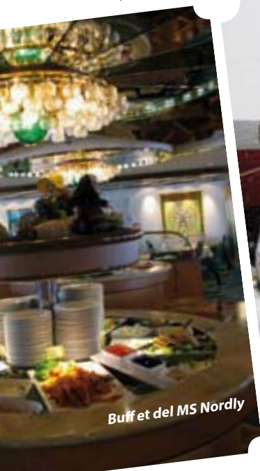
Buffet del MS Nordly

Por la noche el espectáculo estuvo en el salón panorámico del barco, nevaba copiosamente cuando