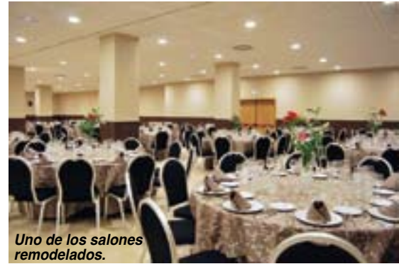
Uno de los salones remodelados.

Así pues, y tras una primera fase en la que durante el año pasado se remodelaron el resto de instalaciones del Gran Hotel Cervantes **** (habitacio-