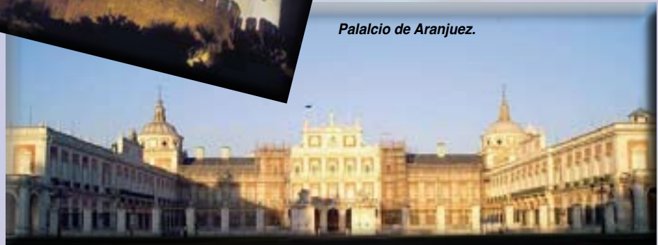
Palacio de Aranjuez.