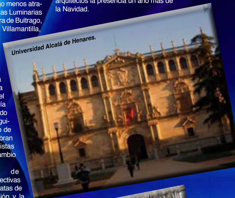
Universidad Alcalá de Henares.

Muy diferentes sin duda a lo que en Navidades ofrece la capital. En Madrid, siete millones y medio de bombillas lucen en 170 espacios públicos y anuncian con diseños de más de una decena de conocidos modistos y arquitectos la presencia un año más de la Navidad.