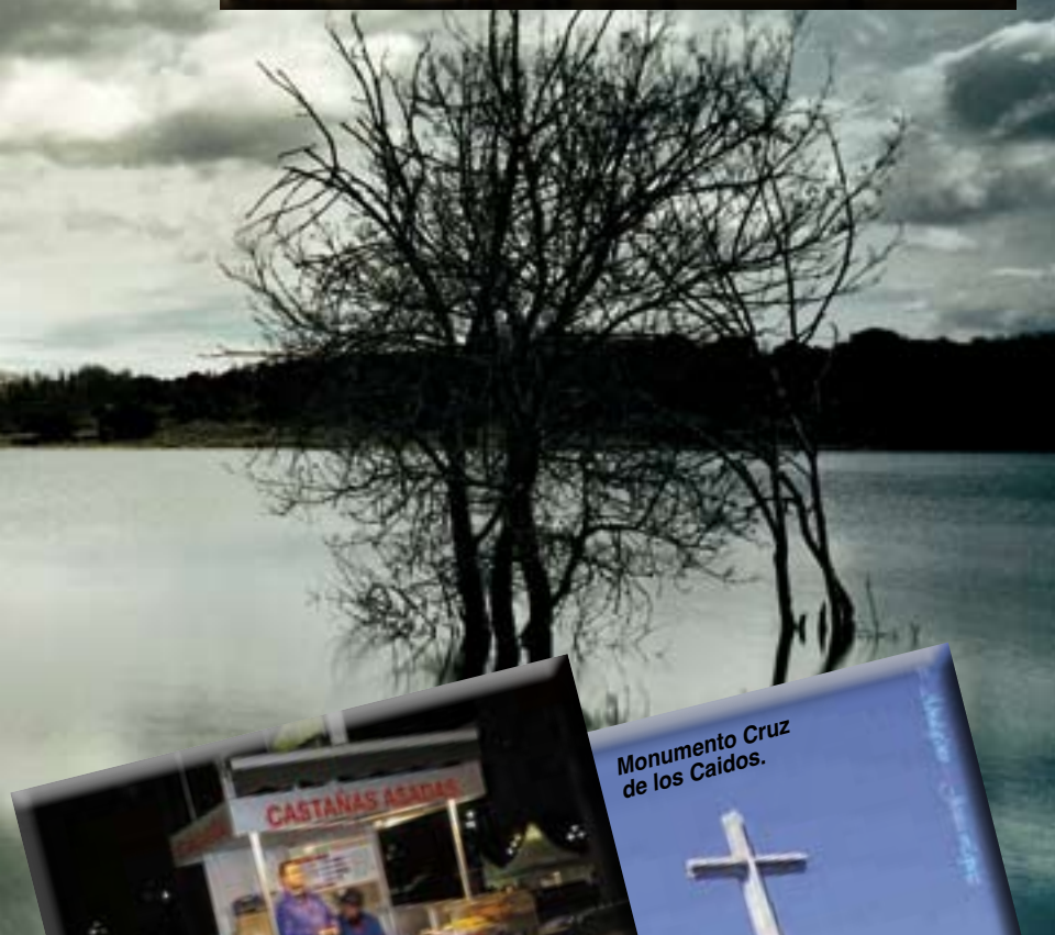
Monumento Cruz de los Caidos.

Con el añadido que en época de Adviento, las actividades por todos los municipios de Madrid y para todos los públicos se multiplican, abarcando desde lo más tradicional a lo más innovador o curioso. De cualquier forma, entre conciertos extraordinarios, concursos de