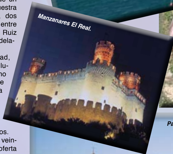
Manzanares El Real.