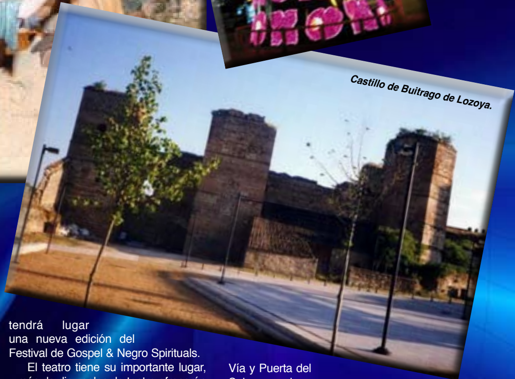
Castillo de Buitrago de Lozoya.

La música es también protagonista destacada en la Navidad madrileña, y uno de los platos fuertes será el concierto "Playing for change" en la Caja Mágica. Nacida hace una década en los Estados Unidos, esta iniciativa reunirá sobre el escenario a un conjunto de músicos callejeros españoles en un concierto benéfico que ayudará a este colectivo a la vez que también recaudará fondos para la construcción de escuelas musicales en Mali y en Nepal.