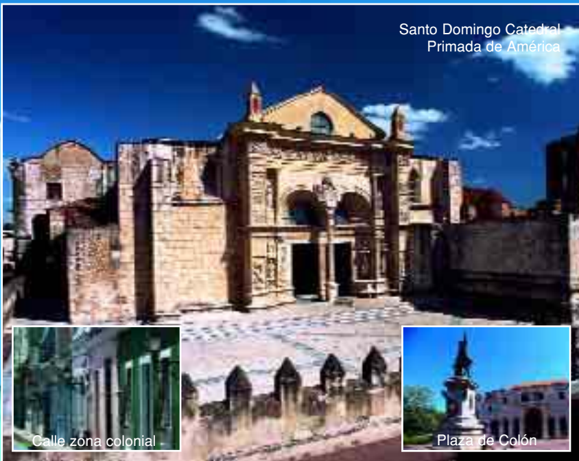
Santo Domingo Catedral Primada de América