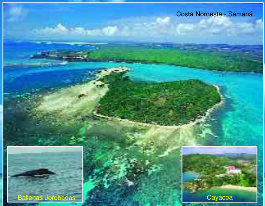
Costa Noroeste - Samaná