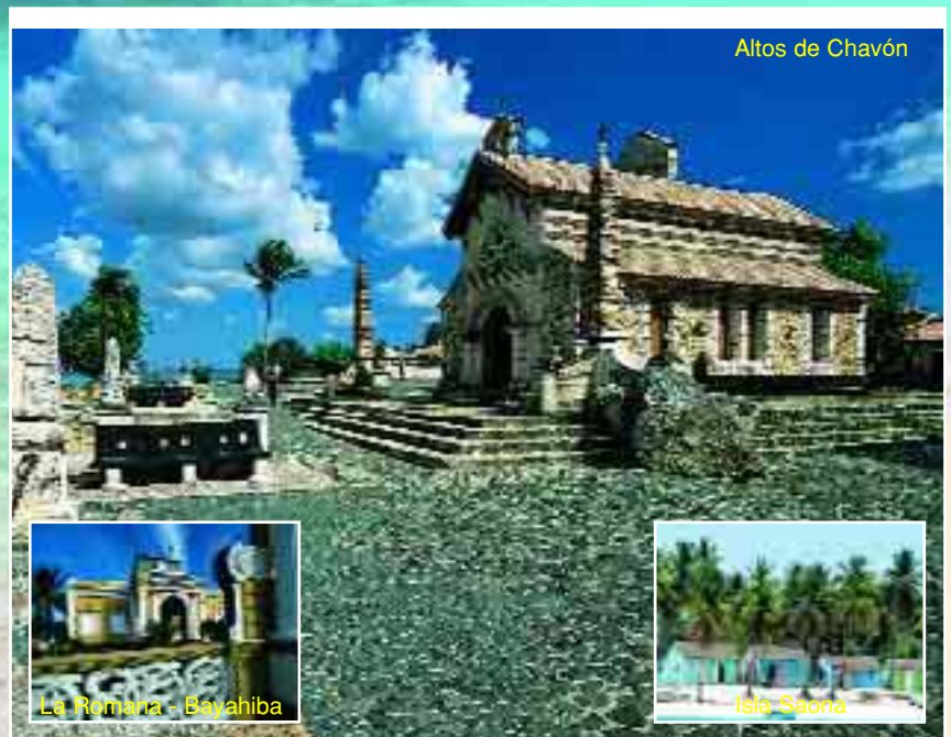
Altos de Chavón