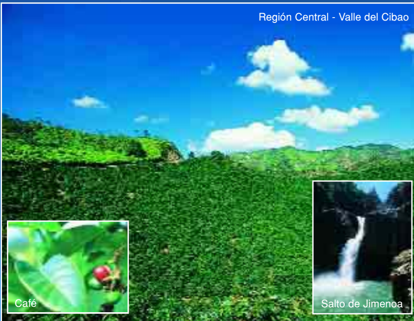
Región Central - Valle del Cibao