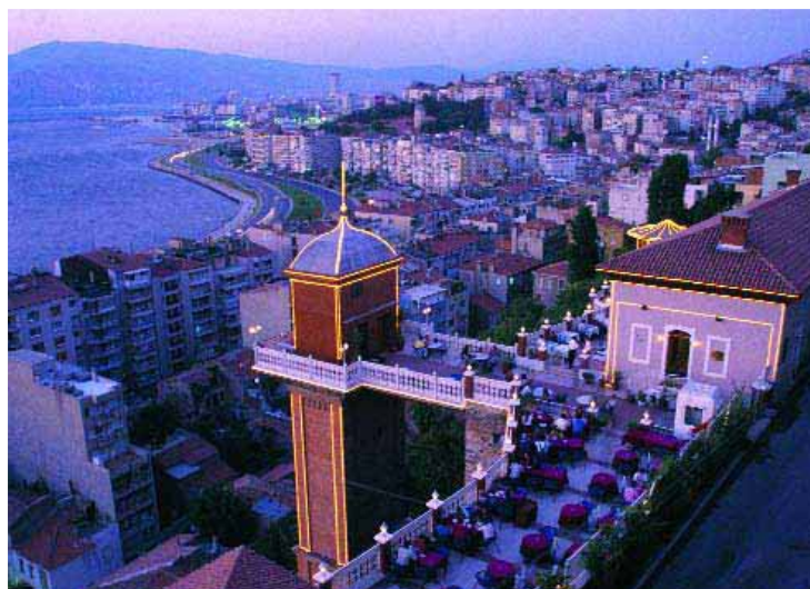
Asansör. El barrio judío de Esmirna (Izmir)

Bergama fue históricamente uno de los principales centros culturales. Hoy es uno de los principales parques arqueológicos de Turquía. Paseando por su acrópolis hay que acercarse a los templos de Trajano y Dionisos, al monumental Altar de Zeus, al Santuario de Deméter o al Gimnasio. La Acrópolis está extendida sobre tres terrazas y el ágora.