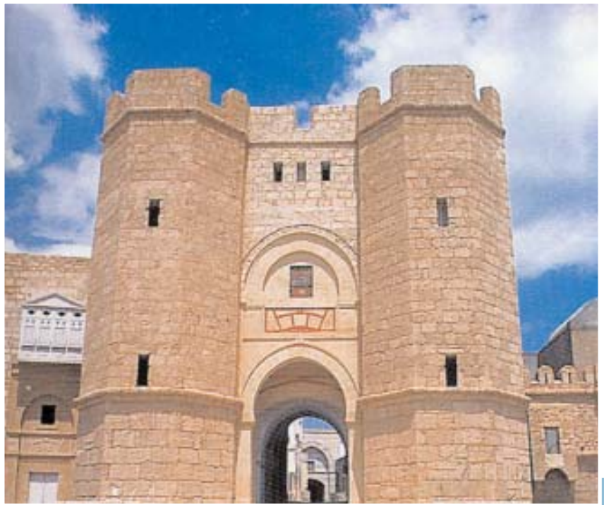
La Medina Mediterráneo

El tiempo de ocio tiene en Túnez y más concretamente en Yasmine Hammamet , uno de los parques más originales del país, donde la historia y la diversión van de la mano. Cartago y su evolución quedan reflejados en este lugar de ocio, donde la cultura es la protagonista del todo el recorrido para este especial Parque que está pensado para todo tipo de visitantes con especial atención al turismo familiar. Aventuras de los corsarios, luchas