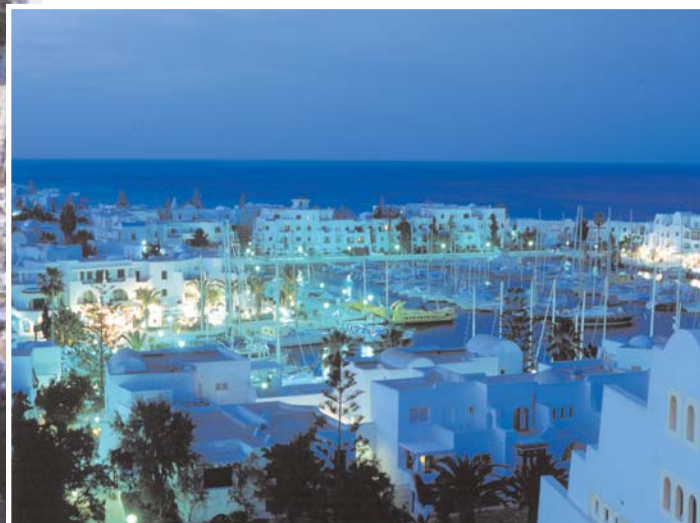
Puerto El Kantaoui

Como su nombre lo indica, Yasmine Hammamet desprende el aroma de un perfume mediterráneo muy típico en Túnez. Esta estación cuyo nombre inspira felicidad, deseo de vivir y hospitalidad, representará, en los próximos años, una instalación turística de mayor atracción. A 60 millas de Sicilia y a menos de 40 millas del puerto deportivo de Sidi Bou Saïd, por el norte, y del puerto deportivo de Port Kantaoui, por el Sur, esta estación balnearia va a ser el futuro producto tunecino del tercer milenio. Se trata de una maravilla arquitectónica y natural que brinda al visitante un perí-