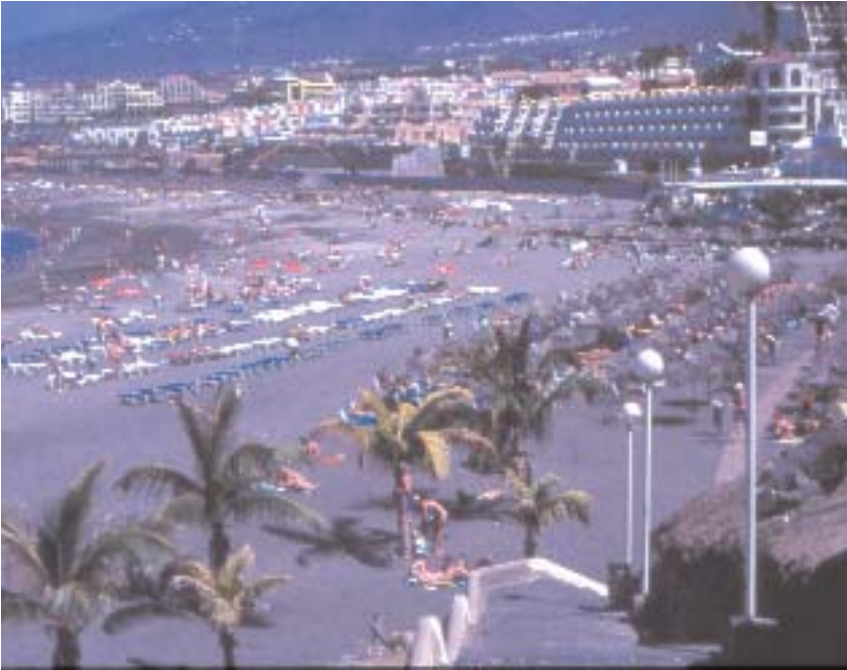
Playa en Santa Cruz de Tenerife

a las Comunidades Autónomas, con una política más coordinadora del Estado y mayor protagonismo de la iniciativa privada. La oferta está concentrada en cinco destinos: Canarias, Baleares, Costa Brava, Benidorm y Costa del Sol, que reciben el 85% del turismo extranjero. La demanda se agrupa en Alemania y Gran Bretaña que llega al 60% del gasto.