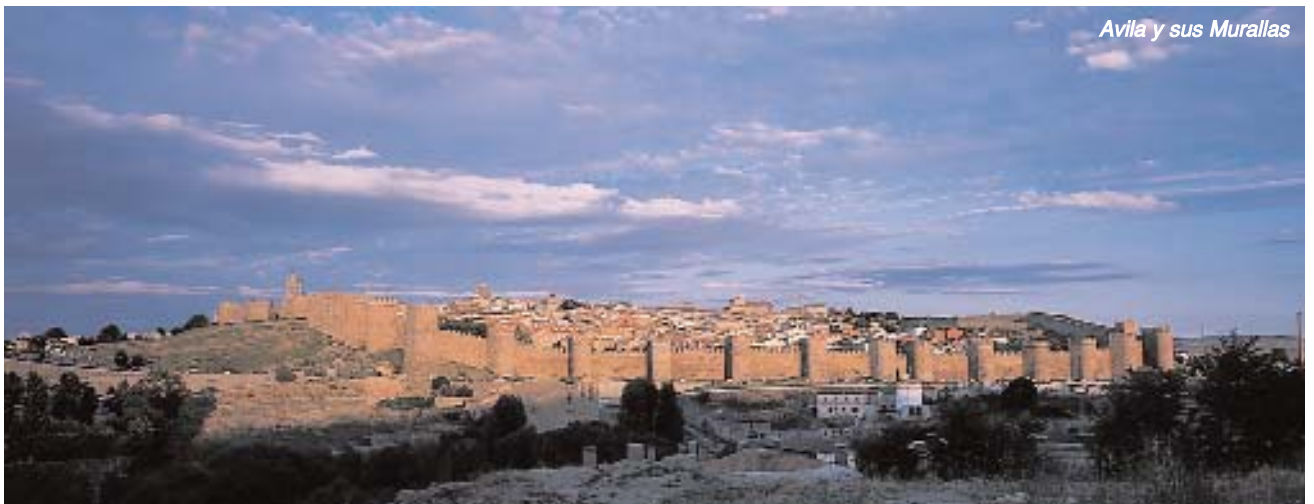
Avila y sus Murallas

E n este repaso al último cuarto de siglo, se pretende señalar, brevemente, los hitos más importantes del panorama turístico español. El año precedente al nacimiento de TAT, se alcanza la cifra casi mágica de los 40 millones de visitantes y se celebra la 1ª edición de la Feria Internacional de Turismo, FITUR. Las competencias puramente turísticas que tenía la Administración Central del Estado, con una política intervencionista de protección al turista como consumidor, seguros, menús turísticos y precios reglamentados, se pasan en parte