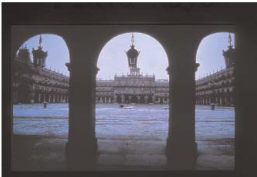
Plaza Mayor de Salamanca

El arte en los carteles de Turismo de España, presentados en la exposición "100 años de Turismo"