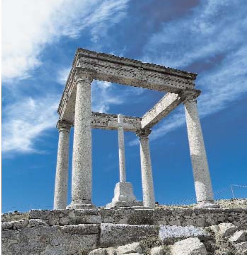
Los cuatro Postes de Avila