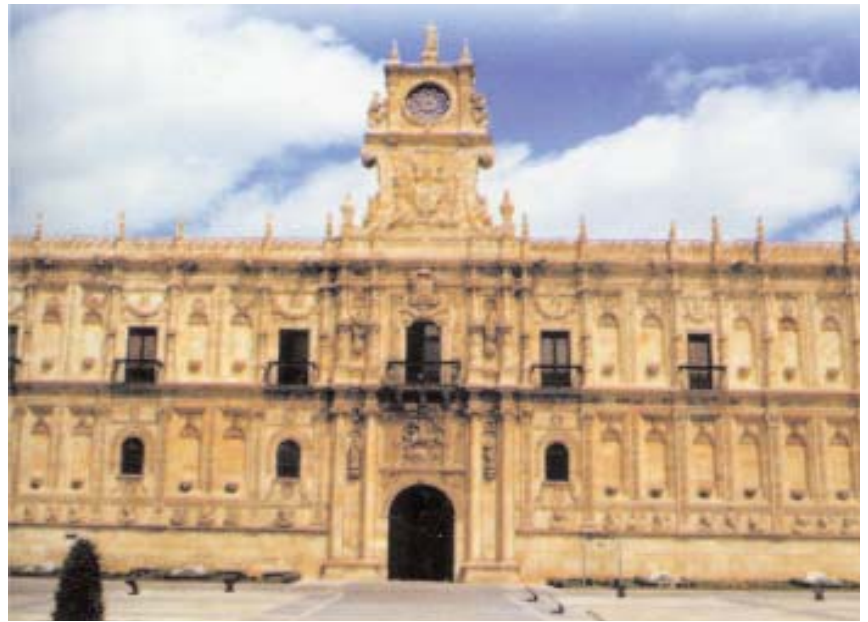
Parador "Hostal San Marcos" en León

categoría inferior. Baleares y Canarias imponen limitaciones a la construcción de nuevas plazas hoteleras con las consiguientes moratorias. En 1995, con la entrada en vigor del Tratado Schengen, se suprimen los controles aduaneros de personas entre siete países de la U.E., se crean el Consejo Promotor de Turismo y el Instituto de Calidad Hotelera Español (ICHE), aparece la Ley de Viajes Combinados, se aprueba el Plan Insular de Lanzarote, declarándose, junto a Menorca, "Reservas de la Biosfera" y se celebra en el Puerto de la Cruz (Tenerife), el I Congreso Nacional sobre la Calidad Turística. También se inaugura el parque temático "Port Aventura".