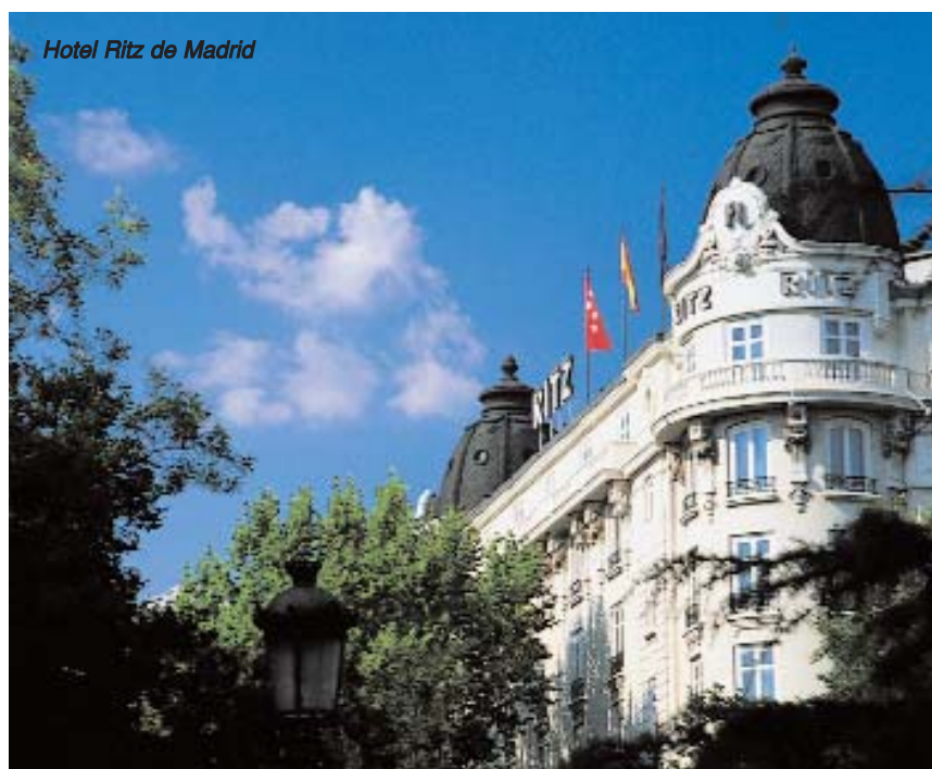
Hotel Ritz de Madrid

La reorganización de la Secretaría General de Turismo y del Inprotur se produce en 1988 así como diferentes disposiciones para estimular la creación de alojamientos hoteleros en Sevilla, Barcelona, Santiago de Compostela y Vía de la Plata. El Camino de Santiago es declarado el Itinerario Cultural Europeo. Son unos años en los que los españoles viajan con más frecuencia al extranjero al ser mayor su poder adquisitivo y ser más favorable el tipo de cambio. El turismo sigue creciendo pero con una nueva visión: la cultura del turismo sostenible. Por eso, al año siguiente, se aprueba la Ley de Conservación de Espacios Naturales y Protección del Medio Ambiente y aparece reiteradamente incumplido el reglamento de la Ley de