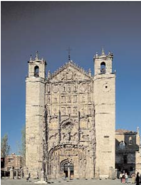
Iglesia de San Pablo de Valladolid

El 92 está marcado por importantes acontecimientos como la inauguración del AVE a Sevilla, la EXPO 92 de Sevilla y las Olimpiadas de Barcelona, lo que provocará que se doble y mejore su planta hotelera y se inicia el primer Plan Marco de Competitividad del Turismo Español (Futures). En 1993, se crea el ministerio de Comercio y Turismo y se inicia el proceso de aplicación de la Agenda 21 para el turismo sostenible. Un año después, se crea la Comisión Interministerial de Turismo para coordinar mejor la política en materia turística con las Comunidades Autónomas y con la iniciativa privada, iniciándose una mejora relevante en la planta hotelera, creciendo los hoteles de 4 y 5 estrellas y disminuyendo los de