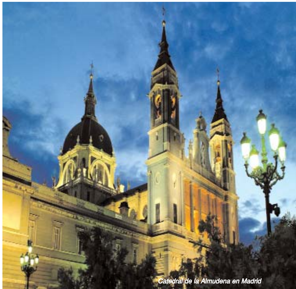
Catedral de la Almudena en Madrid