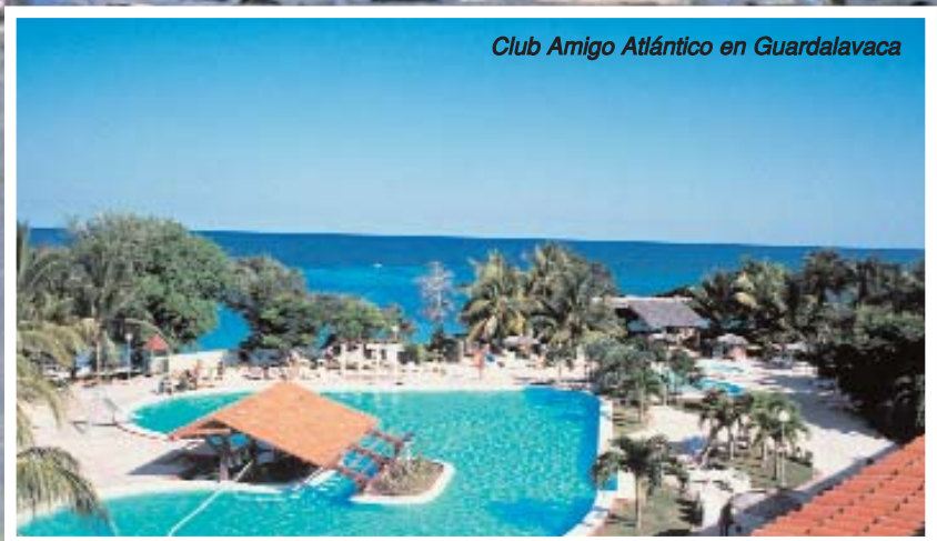
Club Amigo Atlántico en Guardalavaca