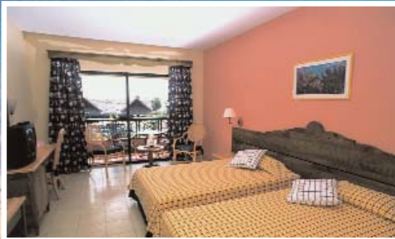
Club Amigo Guardalavaca