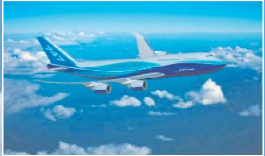
El futuro B 747-8 que presenta Boeing para hacer frente al Airbus A380

Este cuarto de siglo también fue testigo de las despedidas del mítico Caravelle, primer avión de reacción comercial europeo, construido en 1954 y que voló por última vez en 1981, y sobre todo del revolucionario supersónico Concorde, que había empezado a volar en 1969, dejó de fabricarse en 1997, sufrió un trágico accidente al estrellarse contra un hotel de París, el 25 de julio de 2000, y terminó sus servicios el 24 de octubre de 2003, aterrizando en Heathrow procedente de Nueva York. El Concorde nos dejó su último récord en 1995, cuando dio la vuelta al mundo partiendo del aero-