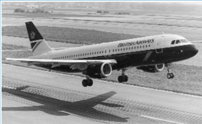
El A320 primer avión comercial en usar el sistema de control automático "flyby-wire"

P ero fue precisamente al iniciarse la década de 1980, cuando la industria aeronáutica dio un paso muy importante y nos maravilló poniendo en servicio los primeros birreactores diseñados por ordenador. Los ya "viejos" reactores de los 1960s y 1970s se quedaron en tierra, y fueron reemplazados por el MD-80 (introducido originalmente como el DC9 serie80), el Boeing 737-300 y el Airbus A310. Desde entonces, estos bimotores han dominado el tráfico comercial con una larga lista de modelos, repartidos entre Airbus, Boeing, McDonnell-Douglas, Tupolev, Antonov, Avro e Ilyushin. Hemos sido testigos de una enorme competencia entre los fabricantes de aviones reactores supersónicos avanzados, como los Boeing 757, 767 y 777 y los Airbus A-320, 330 y 340 (comenzaron a volar en 1988).