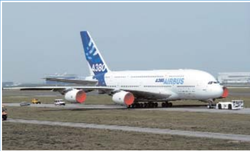
El A380 tiene capacidad para 400 y 800 pasajeros

había pasado de 6 millones de pasajeros en 1981 a más de 17,2 millones en 1989.