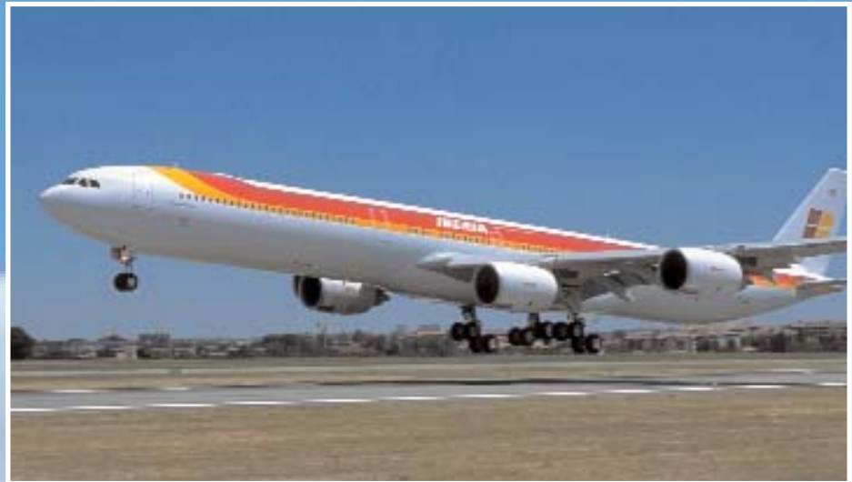
A340-600 con los colores de Iberia, el avión comercial más moderno al que ha incorporado la compañía su nueva clase "Business Plus"

La flota actual es de más de 2.000 aviones, y llega a más de 600 destinos de 135 países, con más de 8.000 vuelos diarios. En 2004 transportó a más de 230 millones de pasajeros. Pero en razón de su tamaño, el segundo lugar